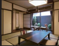
民芸風の客室「遊墨庵 和」