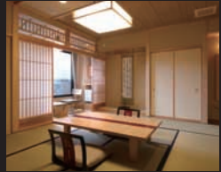
数寄屋風の客室「遊墨庵 萩」