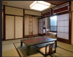
飛騨高山風の客室「遊墨庵 空」

新たに加えた新館「遊墨庵」。3階建て 全11室。飛騨建築風、数寄屋風、民芸風 の3タイプの客室群は、飛騨造りの本館 客室と併せ、いつ訪れても異なった印象の 宿泊を提供する。